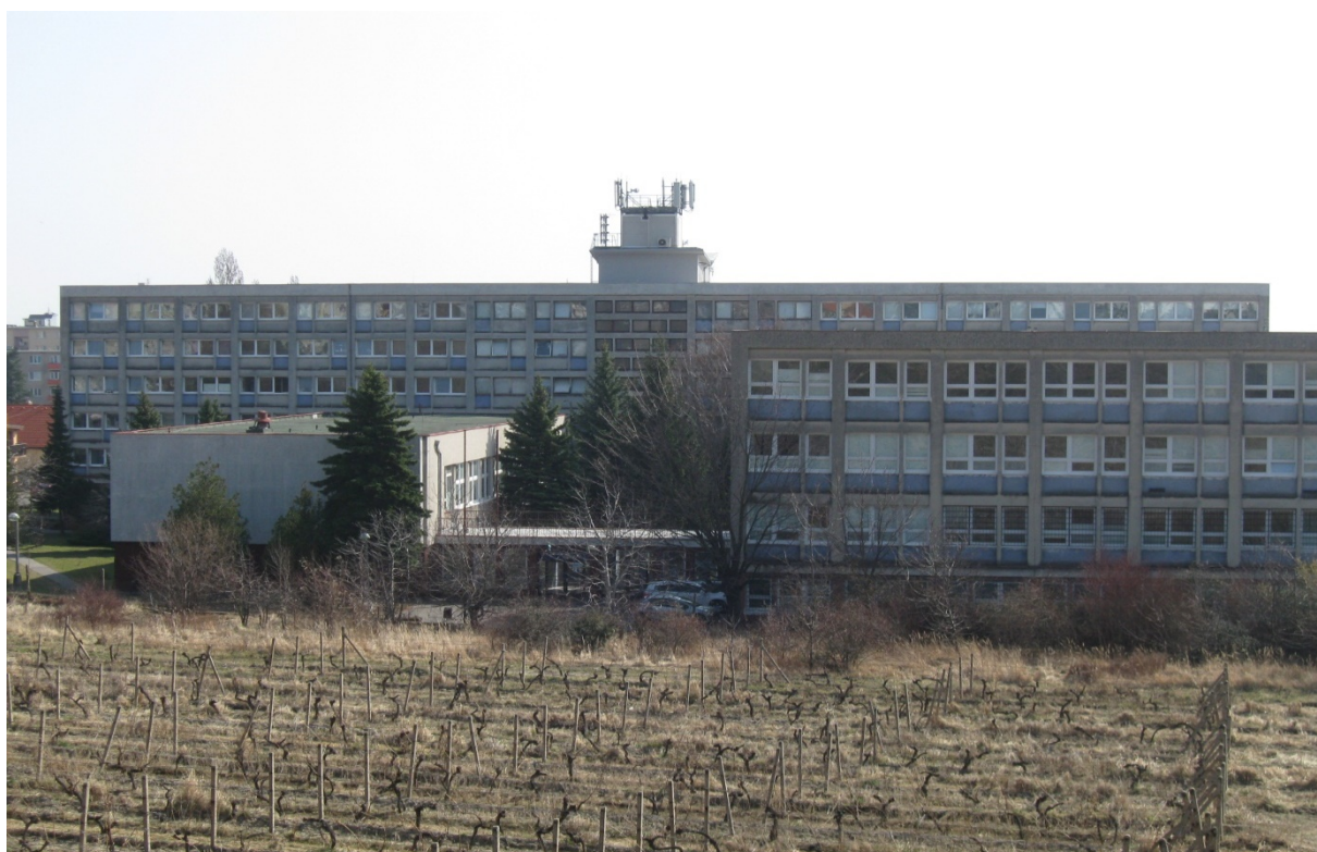
budova internátu – Hliníčka 1